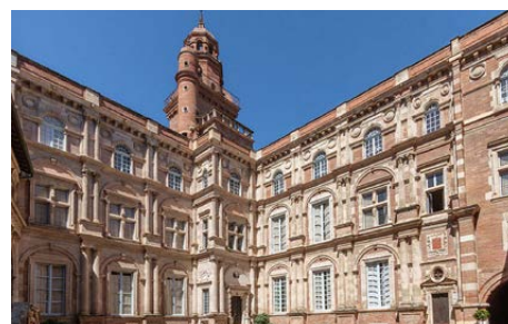
Académie des Sciences, Inscriptions et Belles-Lettres de Toulouse © DR