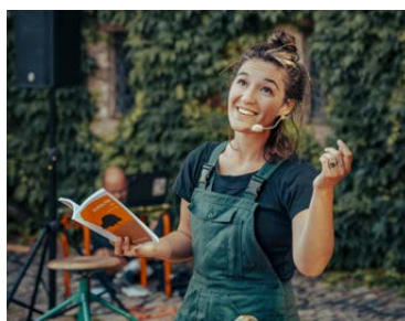
Ruralités par Hortense Raynal