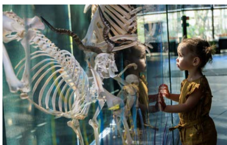
Toulouse - Mur des squelettes - Exposition permanente - 2022

En Occitanie , ce sont plus de 750 événements qui sont organisés dans l'objectif de rassembler un public nombreux autour du plaisir de lire et du partage de la lecture.